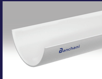
PVC Gutter Pipes