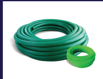
Suction Hose & Garden Hose