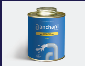
Heavy duty Solvent Cement